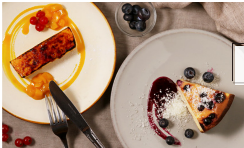
Plate Dessert プレートデザート