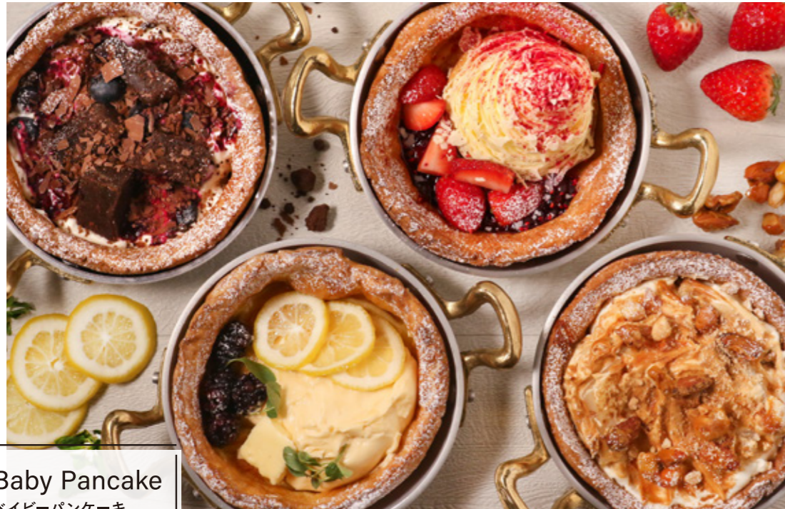
Dutch Baby Pancake ダッチベイビーパンケーキ