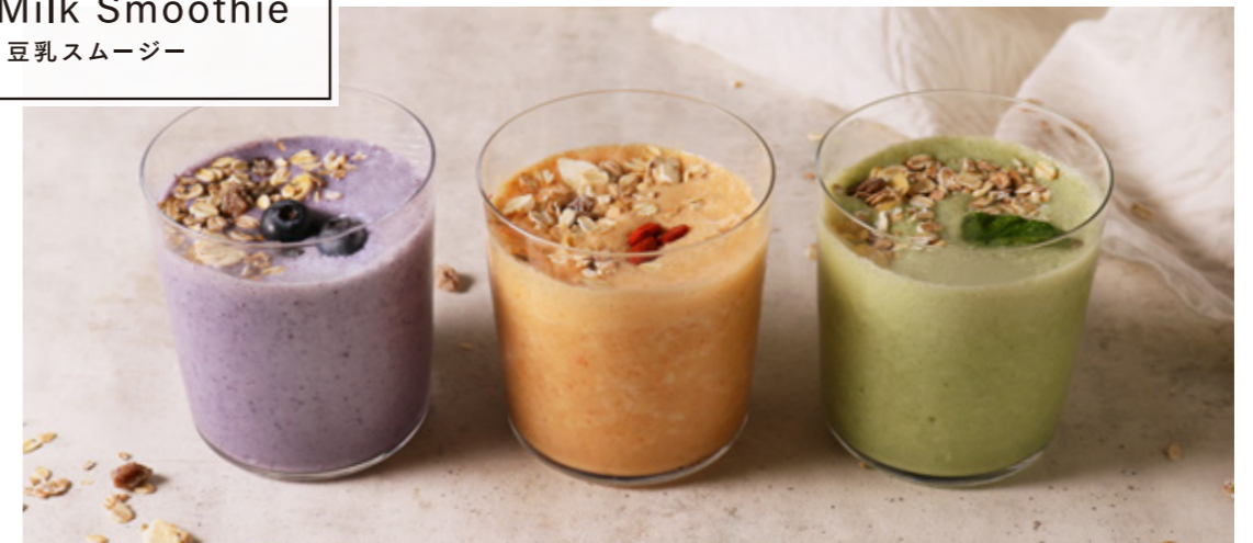
Soy Milk Smoothie 豆乳スムージー