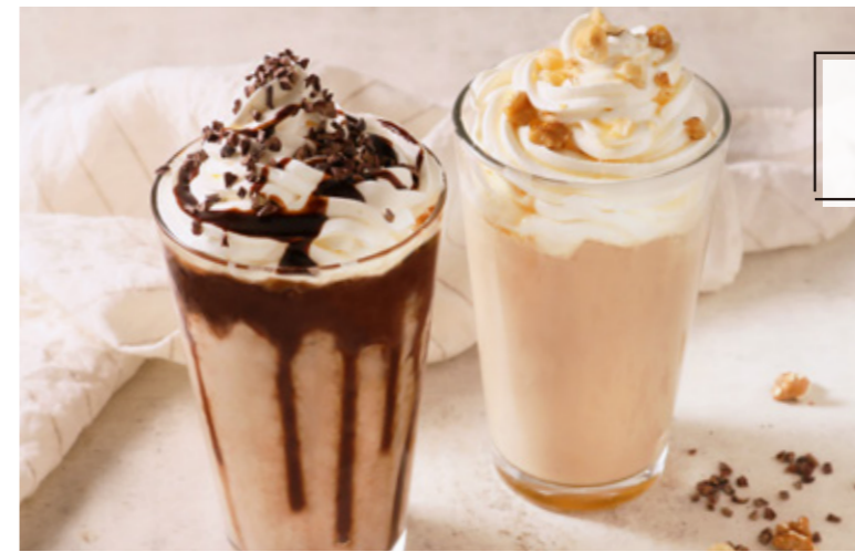
Dessert Smoothie デザートスムージー