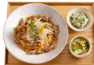
おばんざいセット +455円 (税込500円) ・好きなパスタ ・本日の小鉢 ・八雲豆乳の自家製豆腐