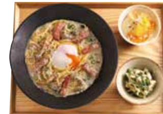
豆乳プリンセット +455円 (税込500円) ・好きなパスタ ・本日の小鉢 ・本日の自家製豆乳プリン