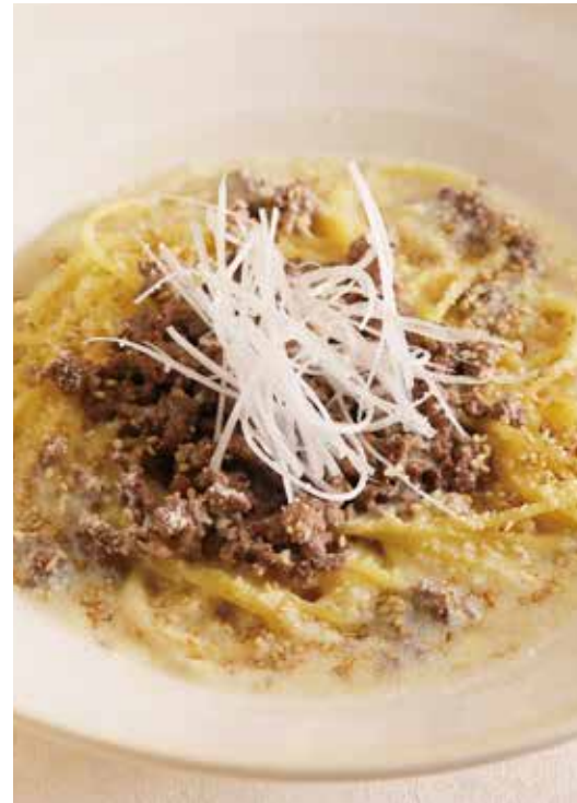
⑥ 淡路産牛の白ごま豆乳ボロネーゼ 1564円 (税込1720円) 生パスタ

淡路島の豊かな自然環境で育った淡路産牛を贅沢に使用したこなの白黒ボロネーゼ。脂と赤身のバランス良いミンチを、生パスタと良く絡むボロネーゼに仕上げました。生姜が効いた白ごま豆乳。コク旨な八丁味噌。あなたは白派?黒派?