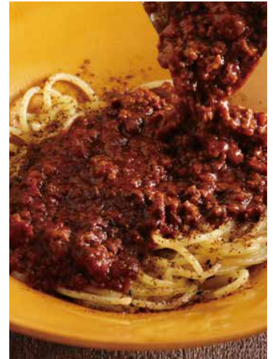
⑦ 淡路産牛の黒ボロネーゼ 1527円 (税込1680円) 生パスタ

淡路産牛と白ごま、豆乳を合わせた、こなの「白」ボロネーゼ。淡路産牛のしっかりとした旨味と、生姜の香りが食欲をそそります。もちっとした生パスタが白ごま豆乳のまろやかなソースとよく絡み、食べ応えのある贅沢な一皿。