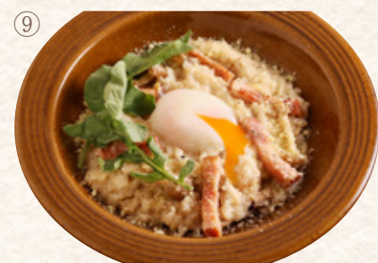
豆乳カルボナーラリゾット

プレート1481yen (税込1630yen) 単品1200yen (税込1320yen)