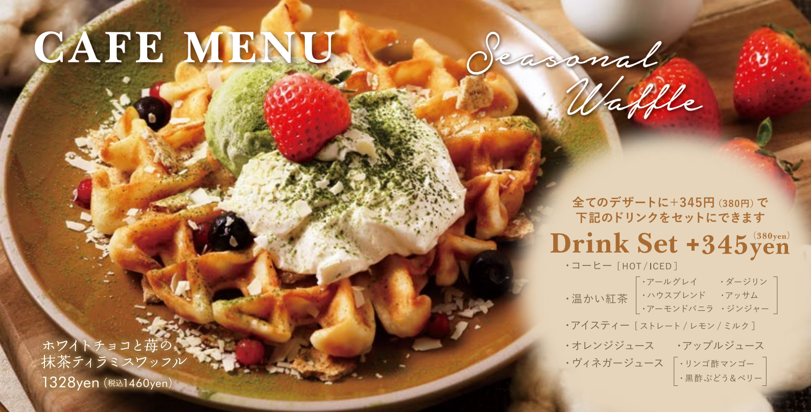
ホワイトチョコと苺の 抹茶ティラミスワッフル 1328yen (税込1460yen)