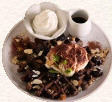
ダークチェリーの ティラミスワッフル 1163yen (税込1280yen)