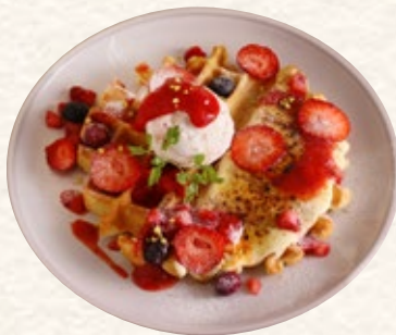
苺とベリーの ブリュレワッフル 1236yen (税込1360yen)