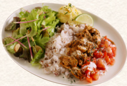
スパイス香るチキンライスプレート