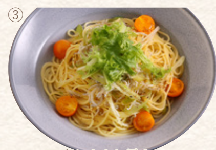
国産しらすと長ネギのポン酢アリオオーリオ

プレート1463yen (税込1610yen) 単品1181yen (税込1300yen)