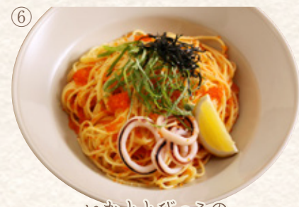
いかととびっこのたらこバター

プレート1663yen (税込1830yen) 単品1381yen (税込1520yen)