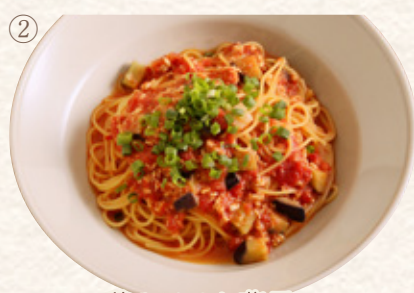
鶏をぼろと茄子の味噌トマト

プレート1463yen (税込1610yen) 単品1181yen (税込1300yen)