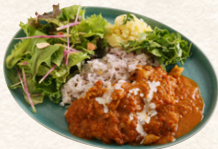
バターチキンカレー

ニューヨーク屋台の定番メニューをココノハ風にアレンジ。数種類のスパイスで味付けしたチキンにライムを絞ってさっぱりと。