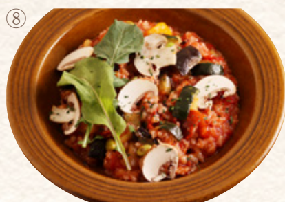
彩野菜のトマトリゾット

プレート1372yen (税込1510yen) 単品1090yen (税込1200yen)