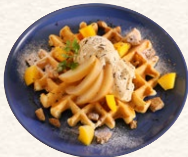
桃のコンポートと 紅茶のワッフル 1072yen (税込1180yen)