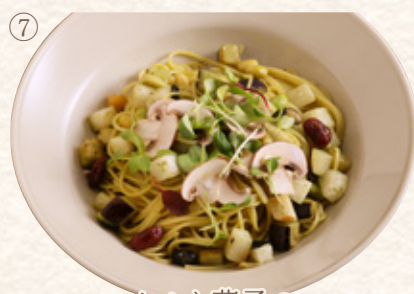
かぶと茄子の大葉ジェノベーゼ

プレート1663yen (税込1830yen) 単品1381yen (税込1520yen)