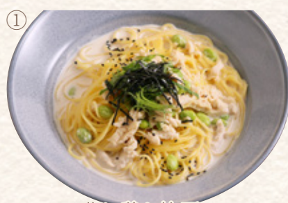
蒸し鶏と枝豆の味噌クリーム

プレート1463yen (税込1610yen) 単品1181yen (税込1300yen)