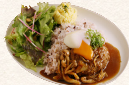
照り焼きハンバーグライスプレート

ヨーグルトのkokとトマトの酸味、バターの旨みで味に深みをプラス。大人も子供も大好き、マイルドな旨味の本格バターチキンカレー。