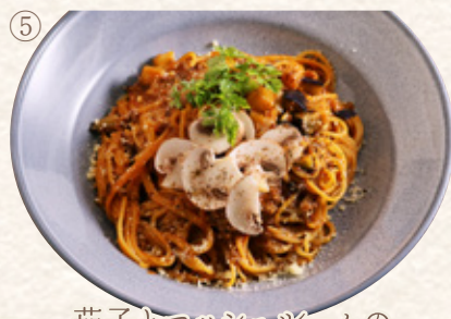
茄子とマッシュルームの八丁味噌ボロネーゼ

プレート1763yen (税込1940yen) 単品1481yen (税込1630yen)