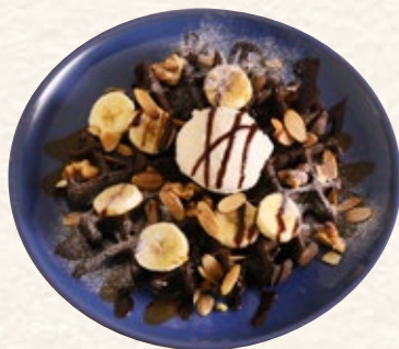
プラリネショコラと バナナのワッフル 1136yen (税込1250yen)