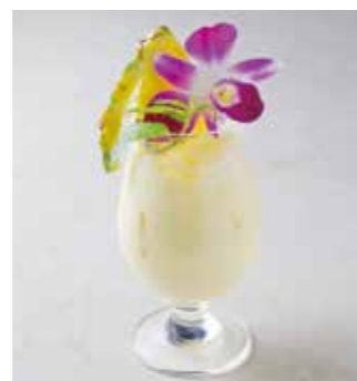
Virgin Piña colada バージンピニャコラーダ パイナップルジュース+ミルク 800 [880]