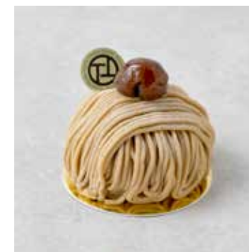
Mont Blanc モンブラン