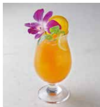
Sunset サンセット オレンジジュース+クランベリージュース 800 [880]