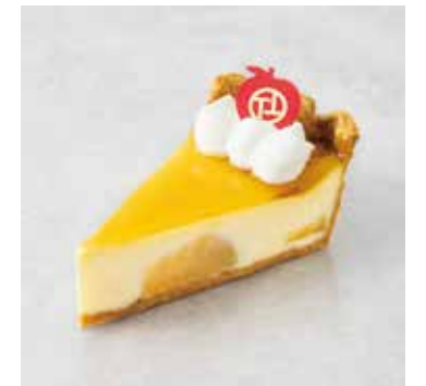
Chaperon りんごのシャペロン