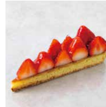
Tarte aux Fraise タルトフレーズ