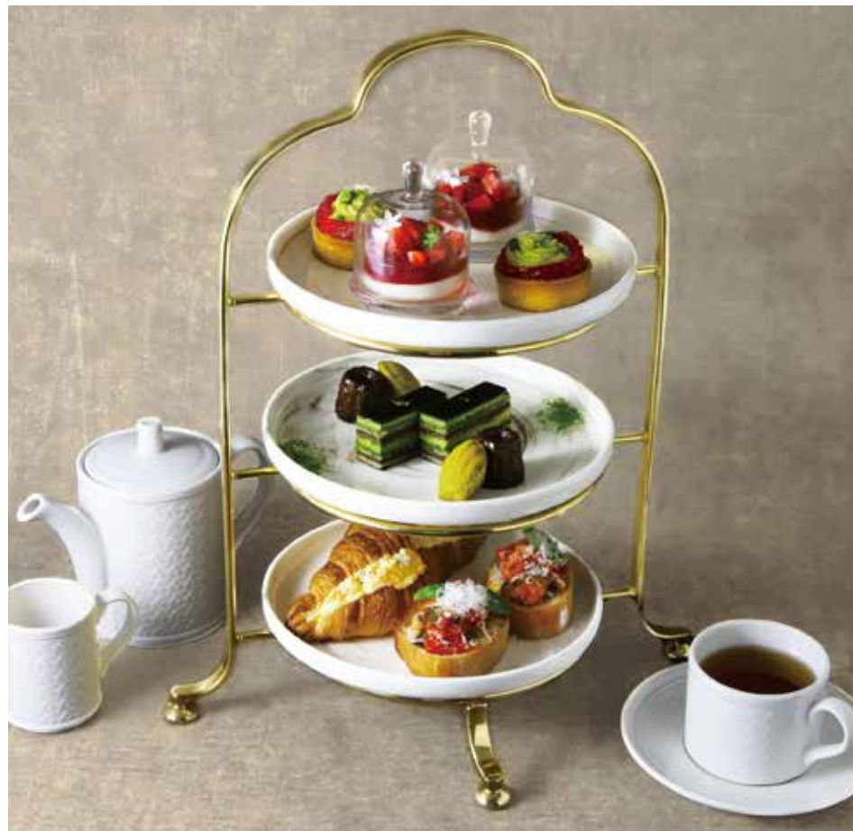
PLATE 1 上段

Strawberry and pistachio tart いちごとピスタチオのタルト