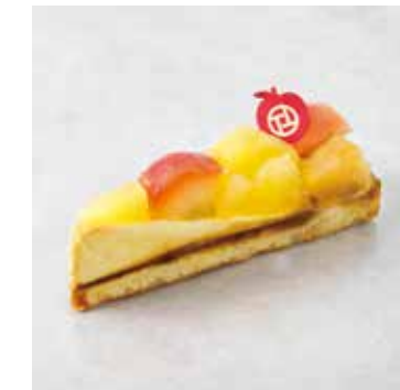
Tarte aux Pommes タルトポムム