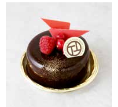
Rubis Chocolat ルビーショコラ