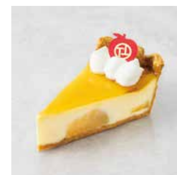
Chaperon りんごのシャペロン