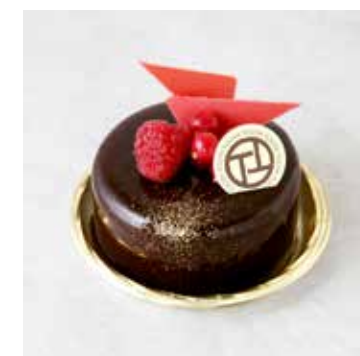
Rubis Chocolat ルビーショコラ