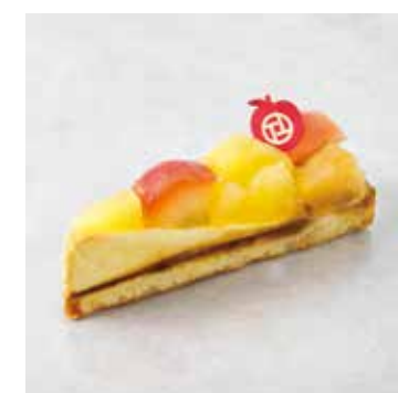
Tarte aux Pommes タルトポナム