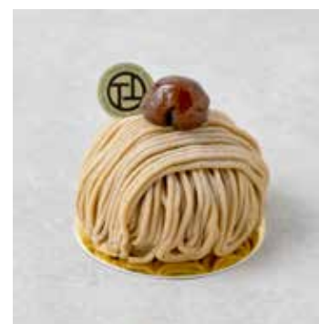
Mont Blanc モンブラン