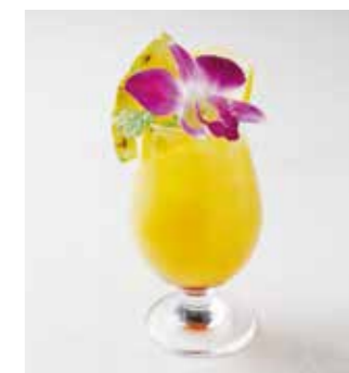
Lovers Holiday ラヴァーズホリデー ラム+パイナップルジュース+グレナデン