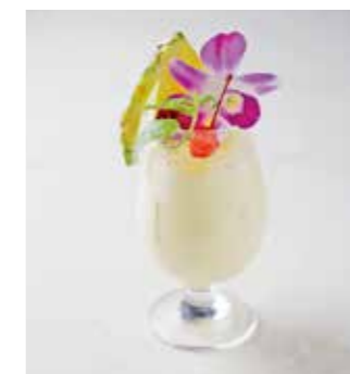
Piña colada ピニャコラーダ ラム+パイナップルジュース+ミルク