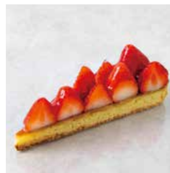
Tarte aux Fraise タルトフレーズ