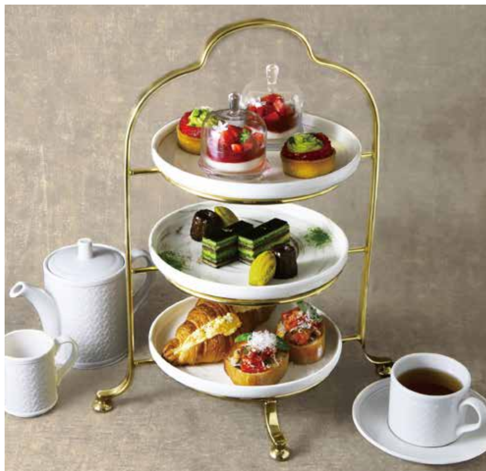
PLATE 1 上段

Strawberry and pistachio tart いちごとピスタチオのタルト