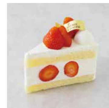
Gâteau aux Fraise ガトーフレーズ

和栗と洋栗をあわせた風味豊かな モンブランクリームに カシスの爽やかさがアクセント