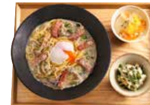
豆乳プリンセット +455円 (税込500円)