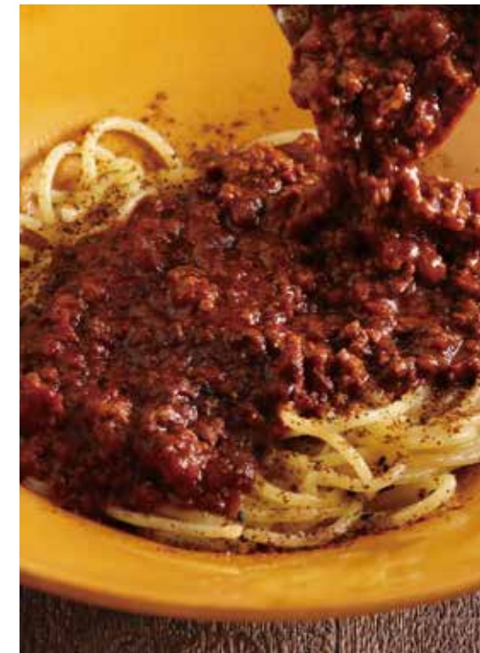
⑦ 淡路産牛の黒ボロネーゼ

淡路産牛と白ごま、豆乳を合わせた、こなの“白”ボロネーゼ。淡路産牛のしっかりとした旨味と生姜の香りが食欲をそそります。もちもちとした生パスタが白ごま豆乳のまろやかなソースとよく絡み、食べ応えのある贅沢な一皿。