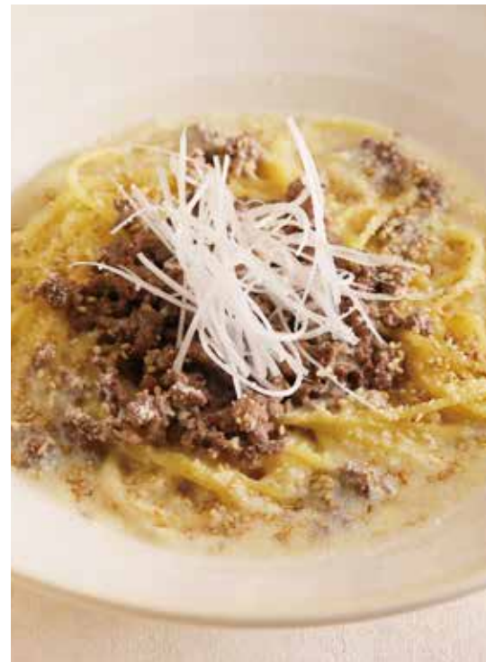
⑥ 淡路産牛の白ごま豆乳ボロネーゼ

淡路島の豊かな自然環境で育った淡路産牛を贅沢に使用したこなの白黒ボロネーゼ。脂と赤身のバランス良いミンチを、生パスタと良く絡むボロネーゼに仕上げました。生姜が効いた白ごま豆乳。コク旨な八丁味噌。あなたは白派?黒派?