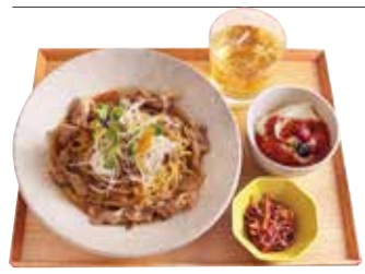
こなな膳 +455円 (税込500円) ・好きなパスタ ・本日の小鉢 ・八雲豆乳の自家製豆腐 ・本日のこなな茶