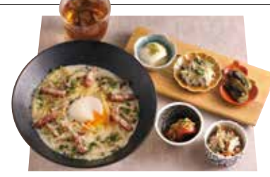
彩り膳 +800円 (税込880円) ・好きなパスタ ・本日のおばんざい5種 ・本日のこなな茶