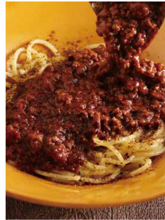
⑥ 淡路産牛の白ごま豆乳ボロネーゼ 1528円 (税込1680円)

淡路産牛と白ごま、豆乳を合わせた、こななの“白”ボロネーゼ。 淡路産牛のしっかりとした旨味と生姜の香りが食欲をそそります。 白ごま豆乳のまろやかなソースを、パスタ麺によく絡めてお召上がりください。