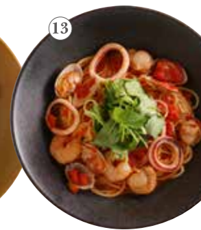
魚介の おだしペスカトーレ 単品1582円 (税込1740円)