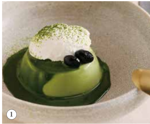
八女抹茶の豆乳プリン 単品591円(税込650円)

こななの自家製豆乳プリンは、ふんわり、なめらかな口溶けがクセになる美味しさです。兵庫県産のこく濃豆乳「八雲豆乳」を使用することで豆乳の豊かな風味が感じられます。こななに来たら一度は食べてほしい自慢の一品。