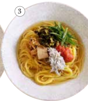
博多明太子としらす 高菜添え 単品991円 (税込1090円)