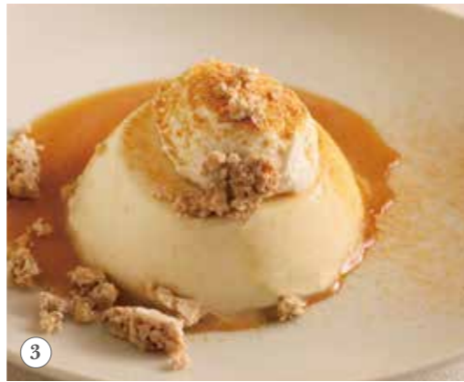
きなこと塩キャラメル の豆乳プリン 単品591円(税込650円)