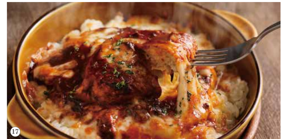
デミグラスソースのチーズハンバーグドリア 単品1500円(税込1650円)