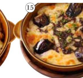
ごろっと茄子の ボロネーゼドリア 単品1182円(税込1300円)