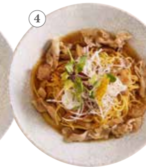
豚肉とみぞれ大根の 柚子風味 単品1364円 (税込1500円)