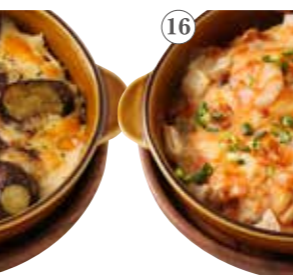
海老とヤリイカの 明太豆乳ドリア 単品1182円(税込1300円)