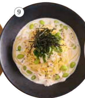
蒸し鶏と枝豆の 味噌クリーム 単品1091円 (税込1200円)