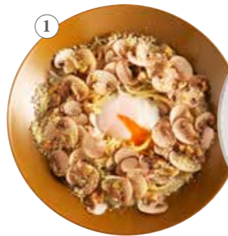
舟形マッシュルームの 豆乳カルボナーラ 単品1482円 (税込1630円)

日本の四季から生まれる素材を丁寧にしっかり愉しむ。 こなの和パスタはすべて、日本の味「おだし」を基本にした味付けです。 素材を大切に、そして季節を愉しむ、そんな和の心からこなの和パスタは作られます。