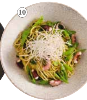
たこと土佐甘とうの 山葵だしペペロンチーノ 単品1291円 (税込1420円)