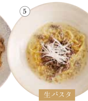
淡路産牛の 白ごま豆乳ボロネーゼ 単品1528円 (税込1680円)