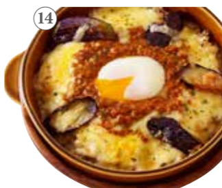
茄子と半熟卵の キーマカレードリア 単品1091円(税込1200円)