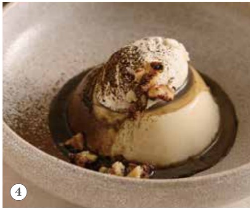
ほうじ茶ティラミスの豆乳プリン 単品591円(税込650円)