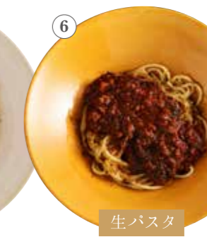
淡路産牛の 黒ボロネーゼ 単品1491円 (税込1640円)