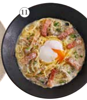
こなの 豆乳カルボナーラ 単品1391円 (税込1530円)