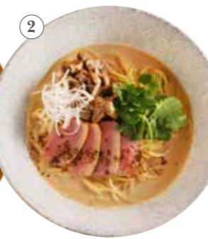
合鴨と舞茸の 醤油豆乳クリーム 単品1255円 (税込1380円)