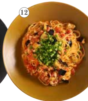
鶏そぼろと茄子の 味噌トマト 単品1182円 (税込1300円)