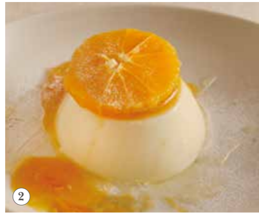
温州みかんの豆乳プリン 単品591円(税込650円)