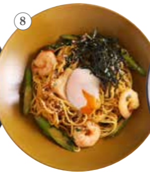
海老とアスパラの 醤油ペペロンチーノ 単品1391円 (税込1530円)