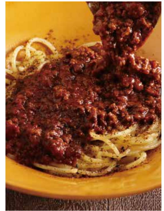
⑥ 淡路産牛の白ごま豆乳ボロネーゼ 1528円 (税込1680円)

淡路産牛と白ごま、豆乳を合わせた、こななの“白”ボロネーゼ。淡路産牛のしっかりとした旨味と生姜の香りが食欲をそそります。白ごま豆乳のまろやかなソースを、パスタ麺によく絡めてお召上がりください。