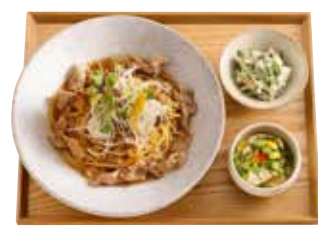
おばんざいセット +455円 (税込500円) ・好きなパスタ ・本日の小鉢 ・八雲豆乳の自家製豆腐