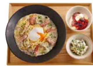
豆乳プリンセット +455円 (税込500円) ・好きなパスタ ・本日の小鉢 ・本日の自家製豆乳プリン