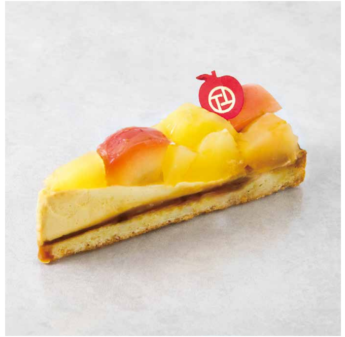
タルトボンム 사과 타르트