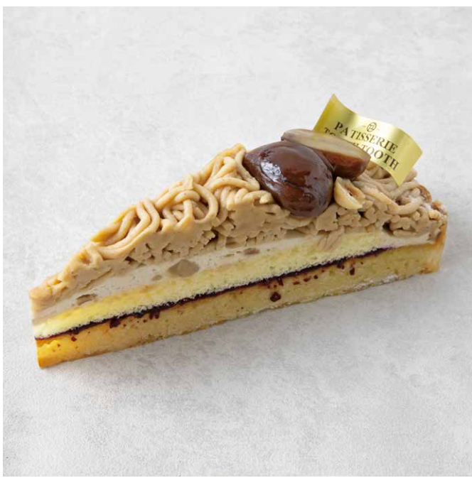
タルトモンブラン 몽블랑 타르트