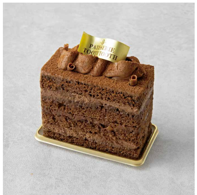
ショコラショコラ 오렌지 초콜릿 케이크