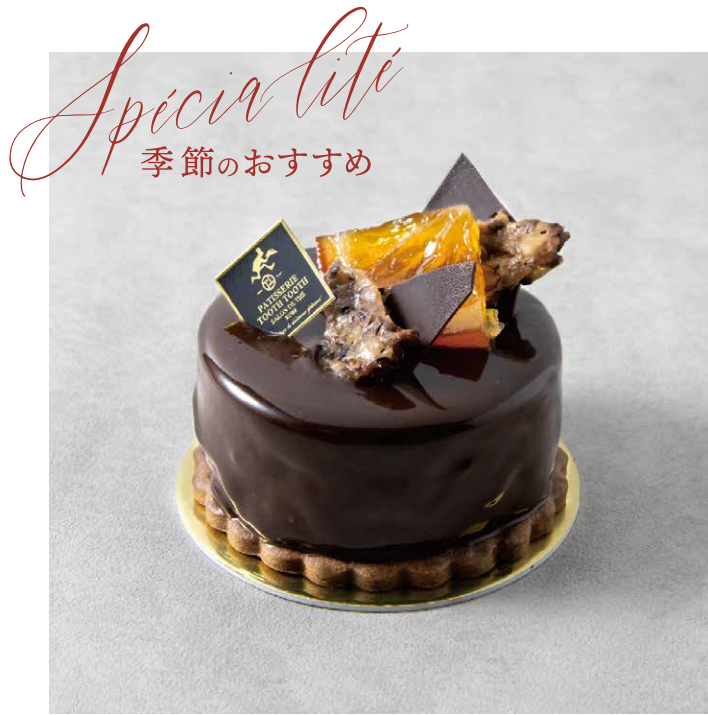
Spicia Lite 季節のおすすめ サアレボン 쇼콜라 오랑주