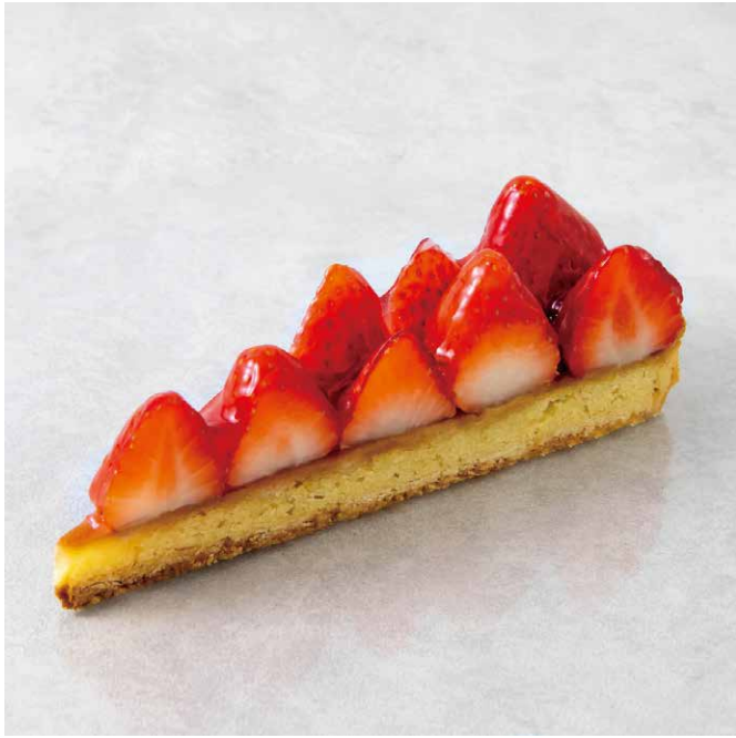
タルトフレーズ 딸기 타르트

※ Please order one drink per person when ordering cake.