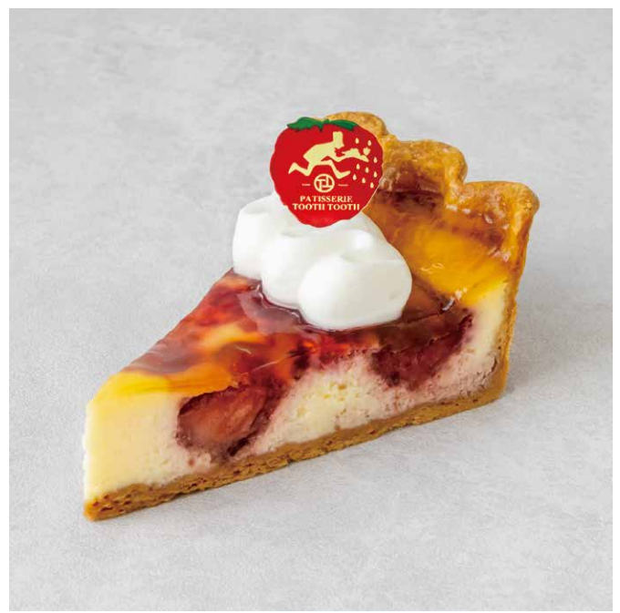
シャベロン 딸기가 들어간 베이크드 치즈 케이크