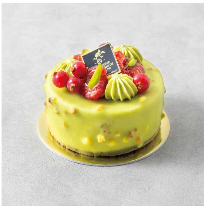
ピスタチオパレ 피스타치오 무스 케이크