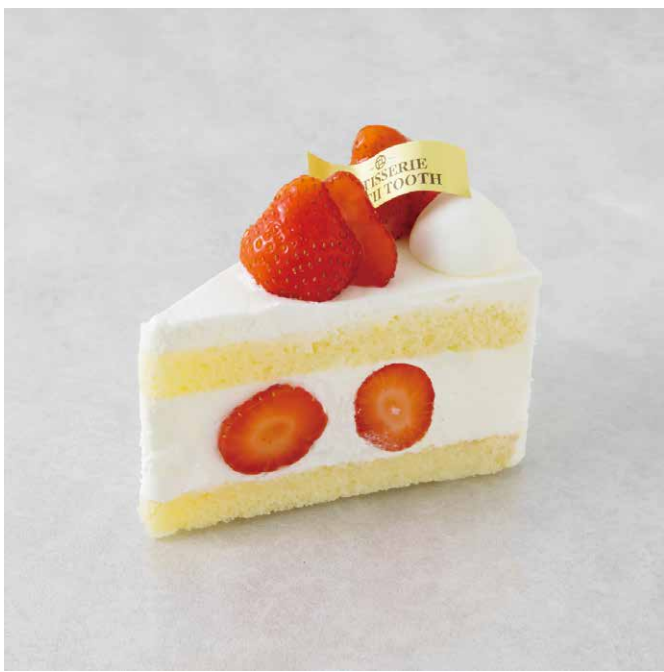
ガトーフレーズ 딸기 쇼트케이크