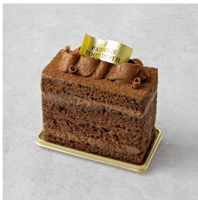
ショコラショコラ