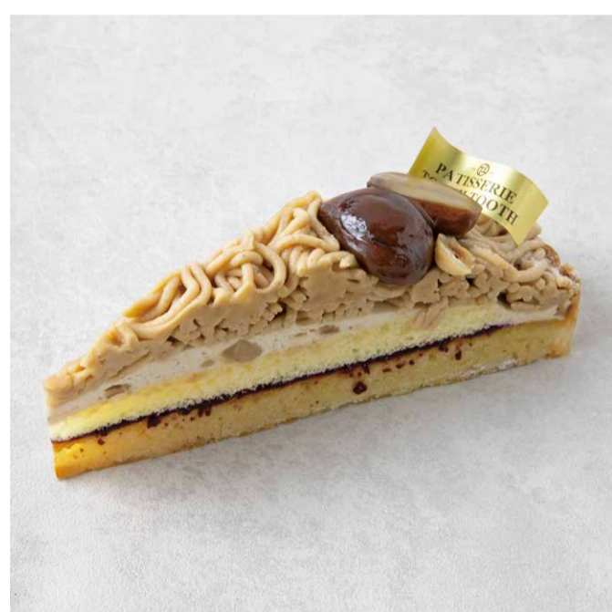
タルトモンブラン