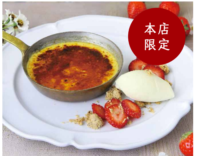
クレームブリュレ 奶油焦糖布丁