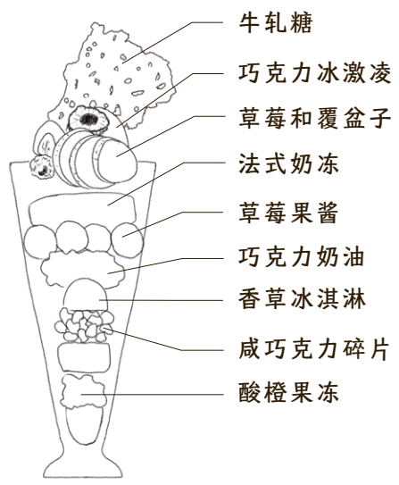
莓とショコラのパフェ 草莓和巧克力百汇