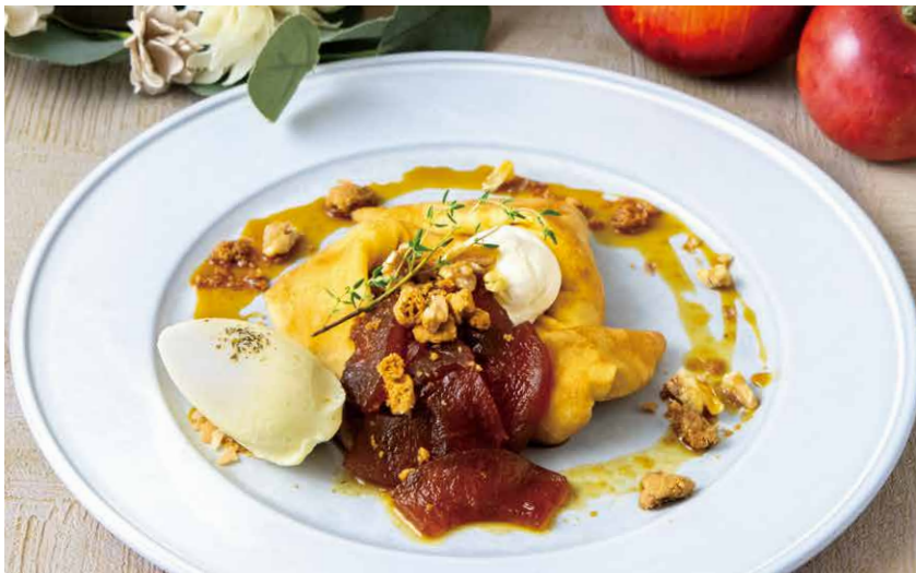
りんごキャラメルのクレープ 焦糖苹果可丽饼