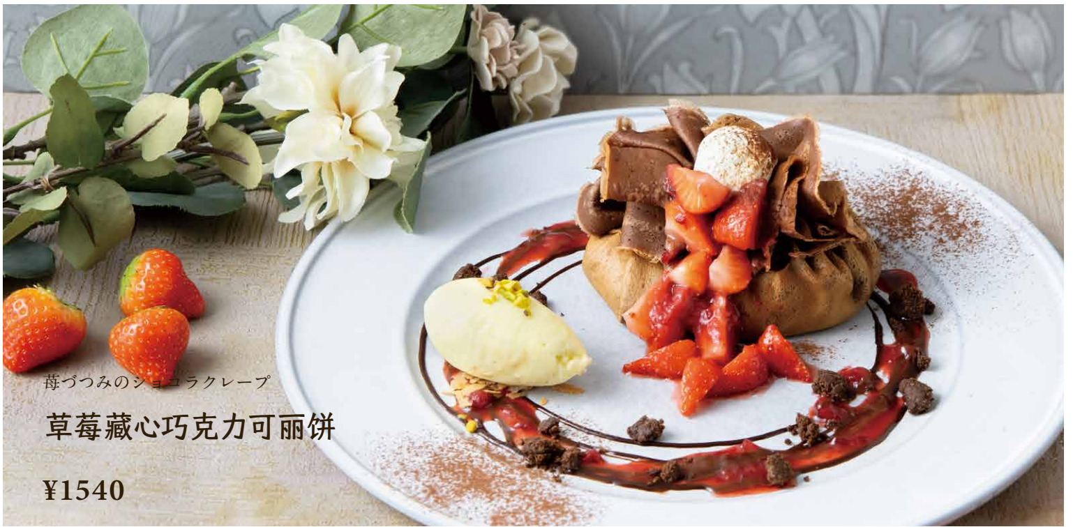
莓づつみのショコラクレープ 草莓藏心巧克力可丽饼