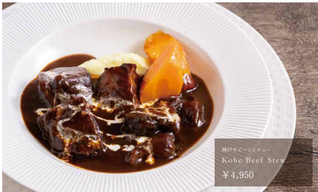
神戸牛ビーフシチュー Kobe Beef Stew ¥4,950