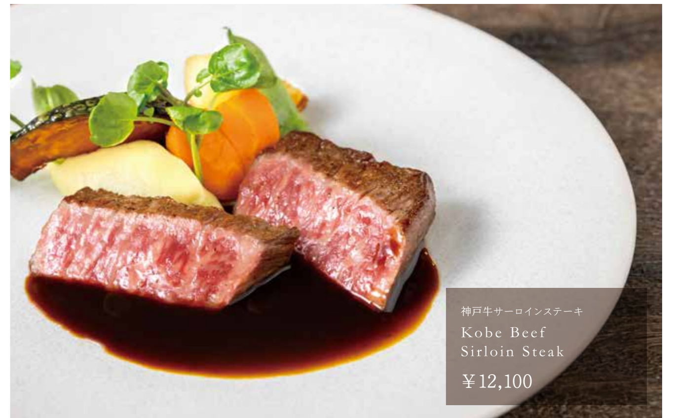
神戸牛サーロインステーキ Kobe Beef Sirloin Steak ¥12,100