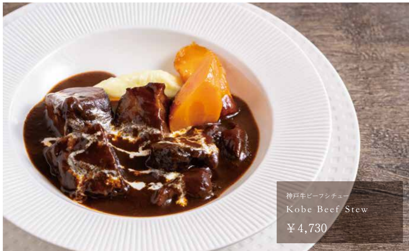
神戸牛ビーフシチュー Kobe Beef Stew ¥4,730