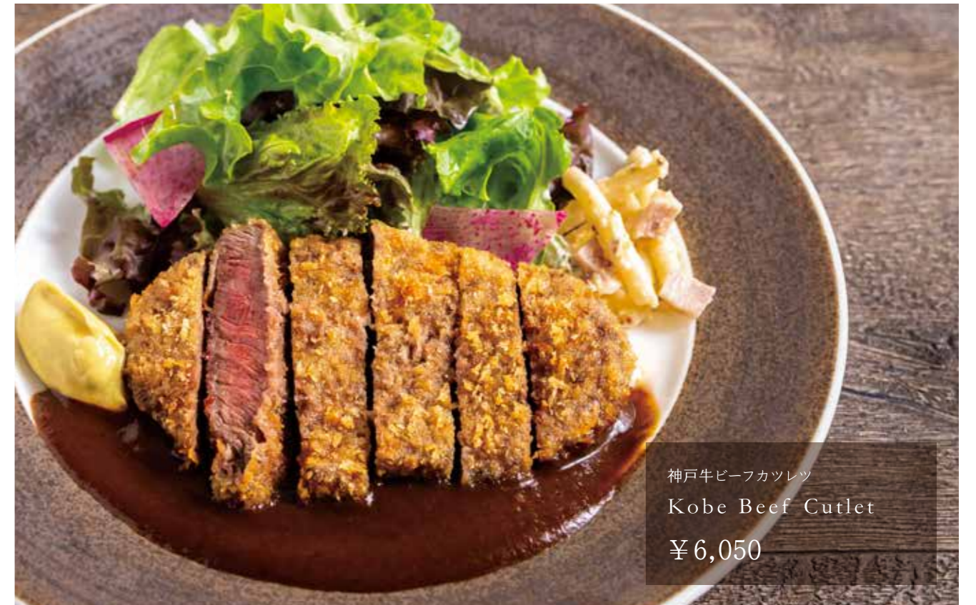
神戸牛ビーフカツレツ Kobe Beef Cutlet ¥6,050