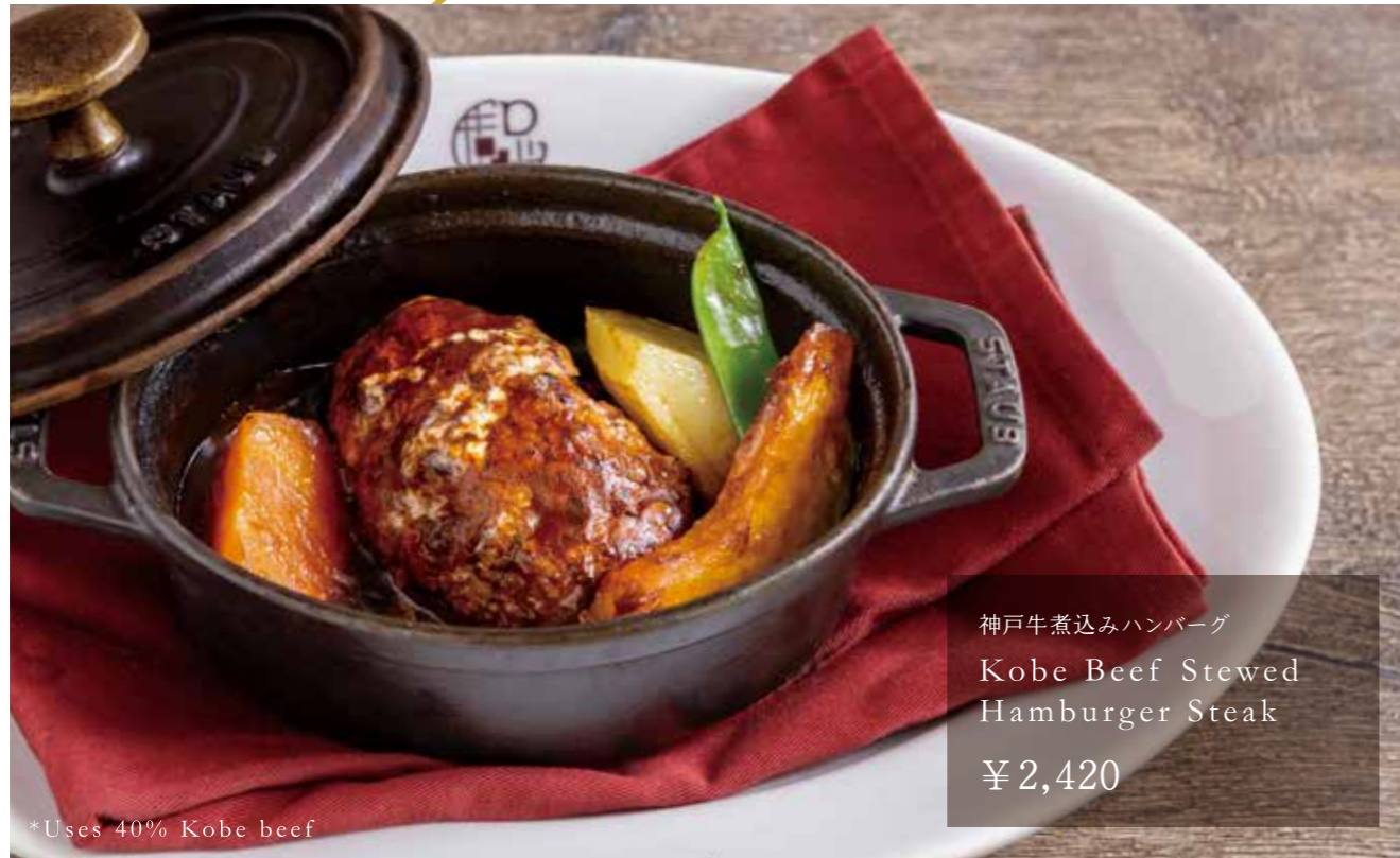
神戸牛煮込みハンバーグ Kobe Beef Stewed Hamburger Steak ¥2,420

世界から認められ、求められるJAPANブランド 『KOBE BEEF』を絶品の神戸洋食としてご用意。 神戸ならではの一品、ぜひご賞味ください。