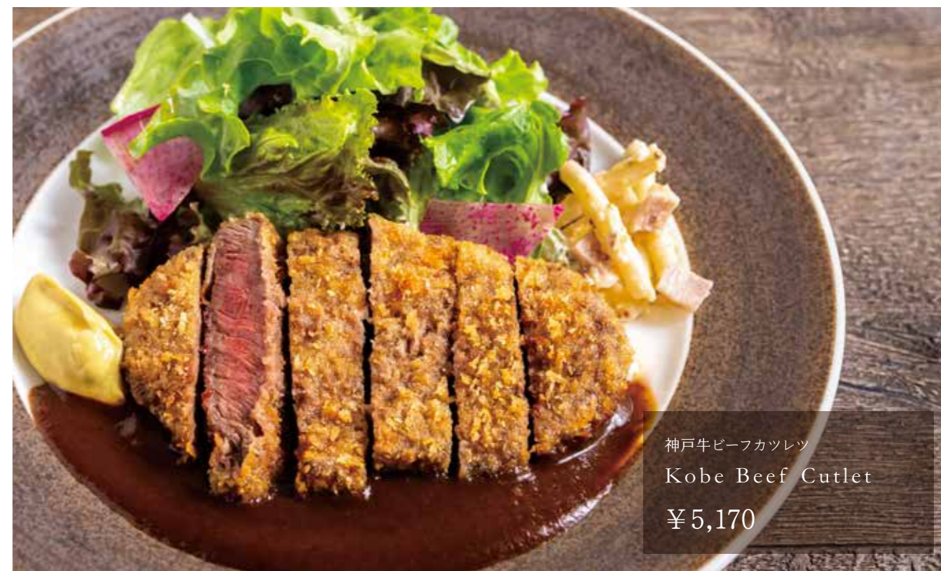
神戸牛ビーフカツレット Kobe Beef Cutlet ¥5,170