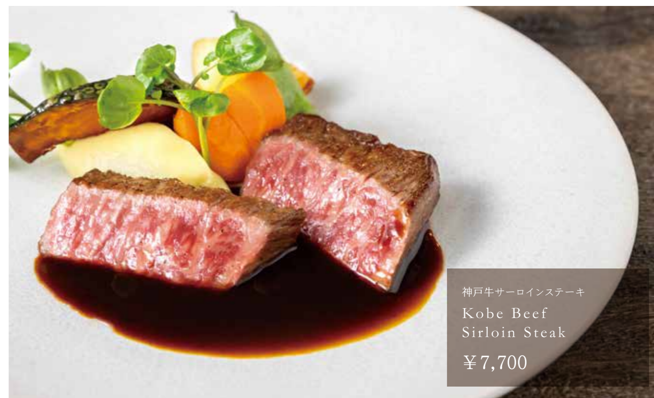
神戸牛サーロインステーキ Kobe Beef Sirloin Steak ¥7,700