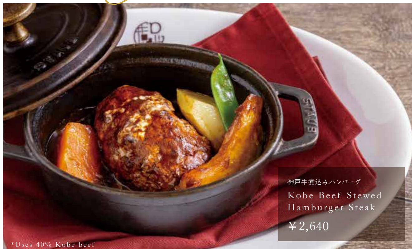
神戸牛煮込みハンバーグ Kobe Beef Stewed Hamburger Steak ¥2,640