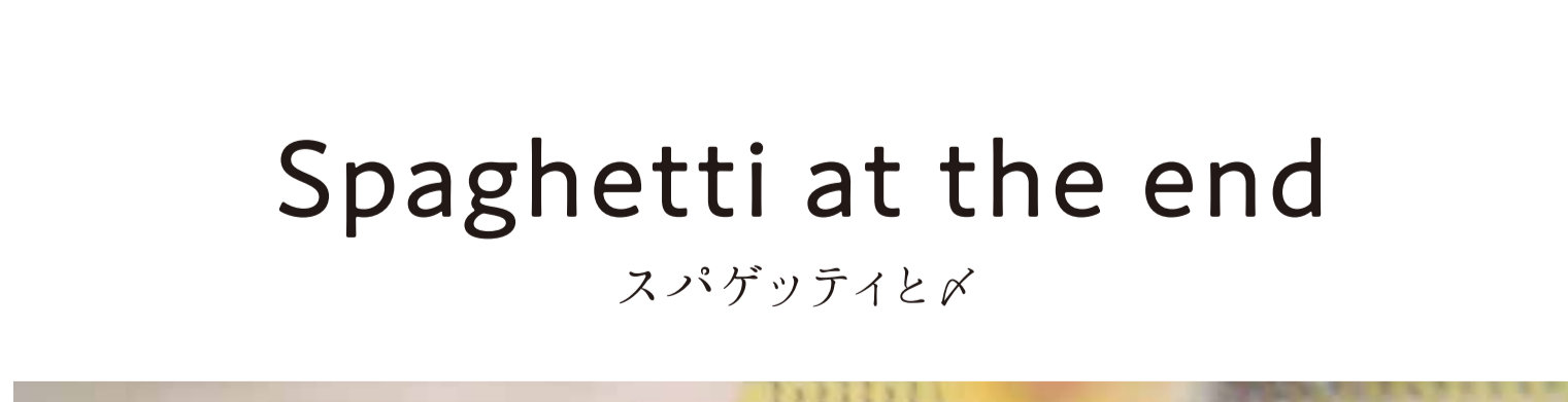
Classic Staples Spaghetti Napolitan ずっと名物 64ナポリタンスパゲッティ たっぷりチーズ 1,630-