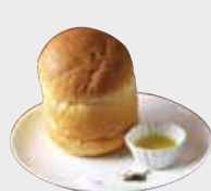
Freshly Baked Bread 焼き立てオリブブレッド