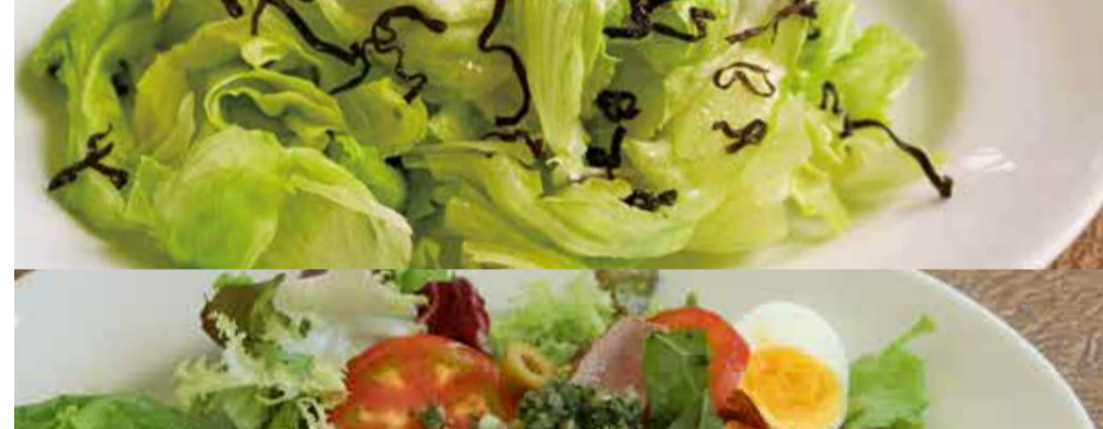
Lettuce and Salted Kombu Seaweed Salad レタスと塩昆布のシンプルサラダ 890-