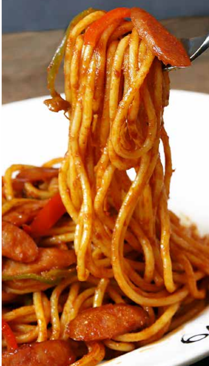
Large Portion +220- 大盛