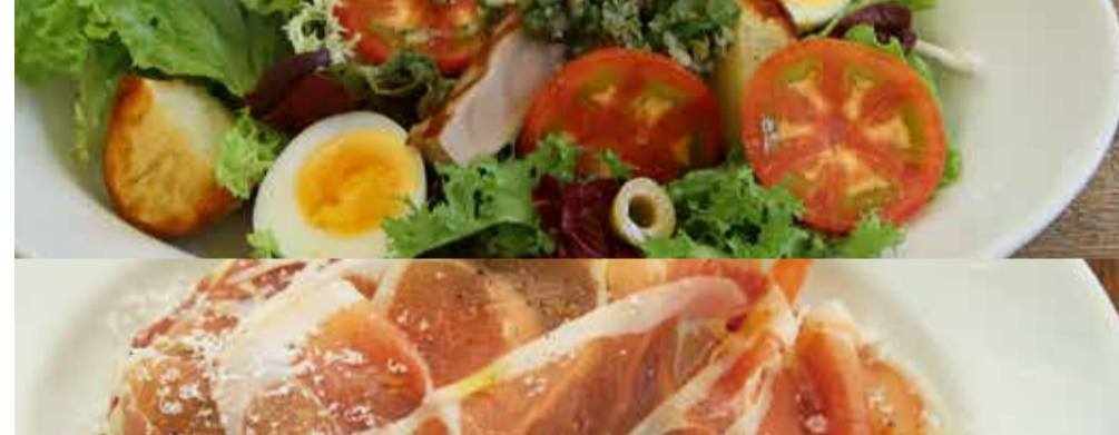
Niçoise Salad ニース風サラダ 1,450-