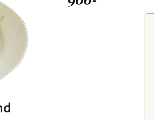
Endive and Blue Cheese アンディーヴのブルーチーズ 900-