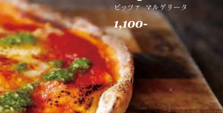
Margherita ピッツァ マルゲリータ 1,100-