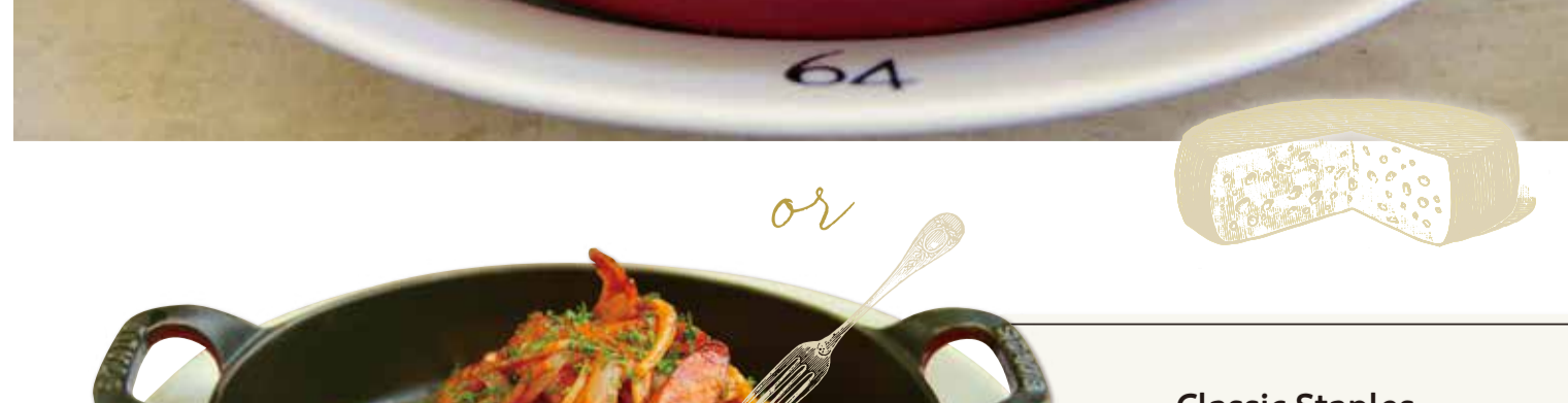
Wasabi Pasta WASABIパスタ 1,080-