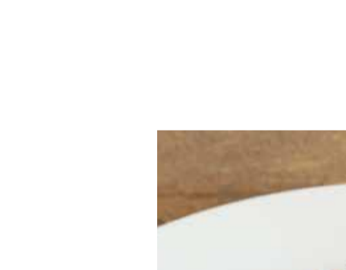
Fried Chicken Spicy 64フライドチキン スパイス 858-