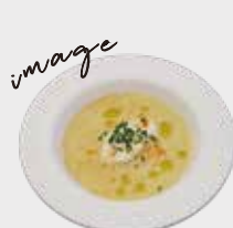
Soup of the Day 本日のスープ