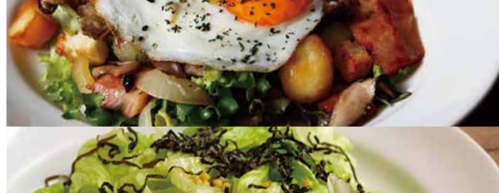
Lyonnais Salad topped with Fried Egg フライドエッグをのせた 64リヨネーズサラダ 1,200-