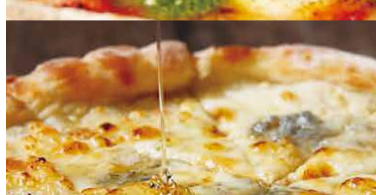
QuattroFormaggi with Honey クワトロフォルマッジ 蜂蜜添え 1,300-