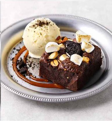
ROCKY ROAD CHOCOLATE CAKE