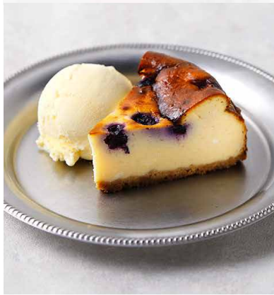
BLUEBERRY BASQUE STYLE CHEESECAKE